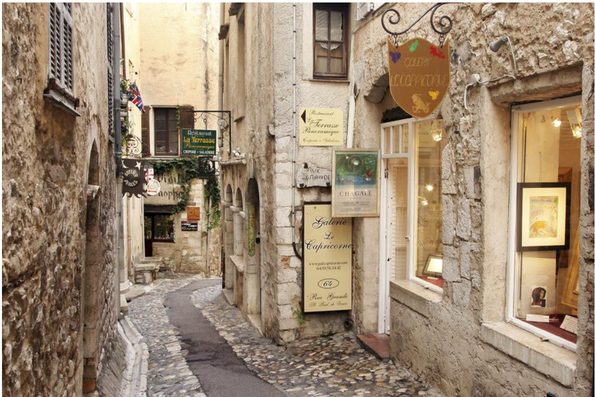
사진 10 생폴드방스의 예쁜 골목길