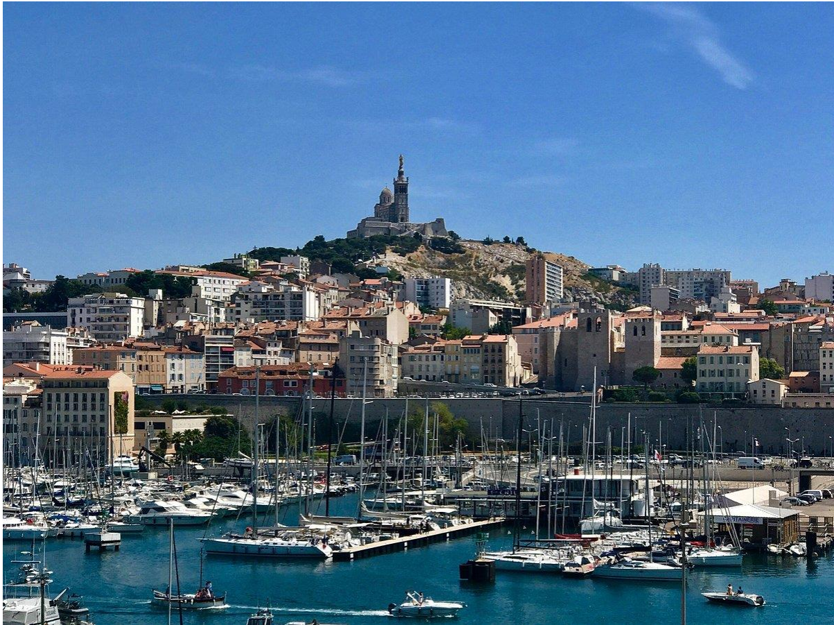
사진 1 마르세유 전경, 산 위에 보이는 성당이 마르세유의 상징인 Basilique Notre-Dame de la Garde 으로 구항구에서 버스나 Petit Train 으로 갈 수 있습니다.

(Faculté des sciences de Luminy, Aix-Marseille Université)나 까시스(Cassis)에서 출발하는 코스를 추천합니다.