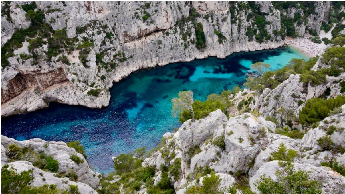
사진 3 깔랑크