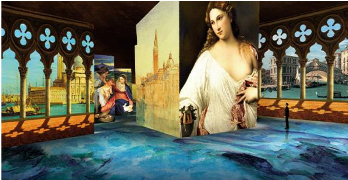
사진 13 레보드프로방스에 위치한 빛의 채석장(Carrieres de Lumieres) 내부, Venice, La Serenissima/Yves Klein, Infite Blue 라는 주제로 환상적인 빛의 공연이 올해 말까지 진행된다고 합니다.