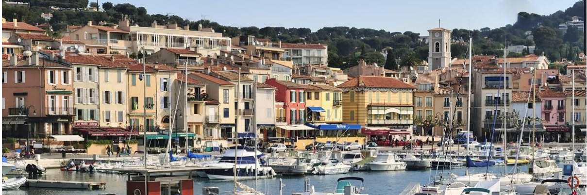
사진 5 까시스 전경

마르세유에서 북쪽으로 약 30 분 거리에는 '분수의 도시', '작은 파리'라 불리는 액상 프로방스(Aix-en-Provence)가 위치해 있습니다. 시내 중심 Rotonde 분수를 중심으로 도보로 작은 상점들과 레스토랑, 바 등이 밀집한 아름다운 골목들을 거닐 수 있습니다. 액상 프로방스는 폴 세잔(Paul Cézanne)의 고향으로 그가 작업한 공간(Atelier Ceranne), 그라네 박물관 (Musée Granet) 등도 더위를 피해 들릴만한 곳입니다.