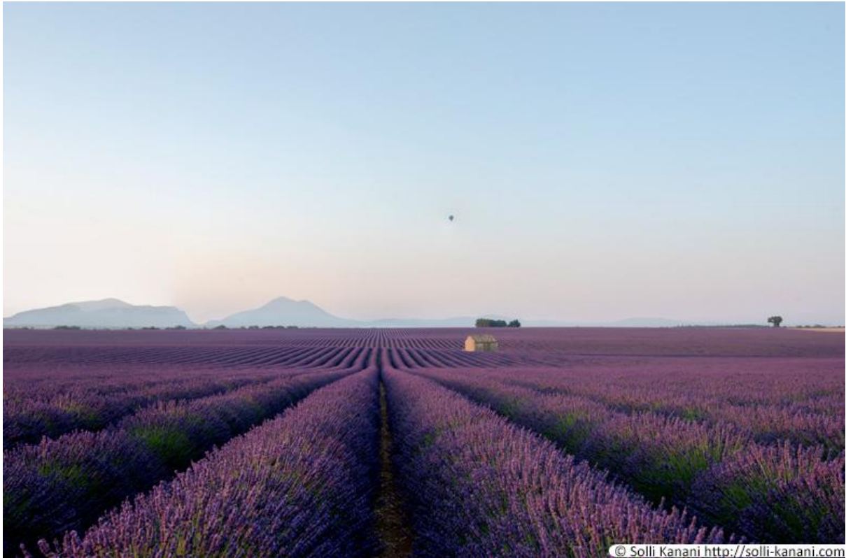
사진 9 발랑술의 라벤더밭