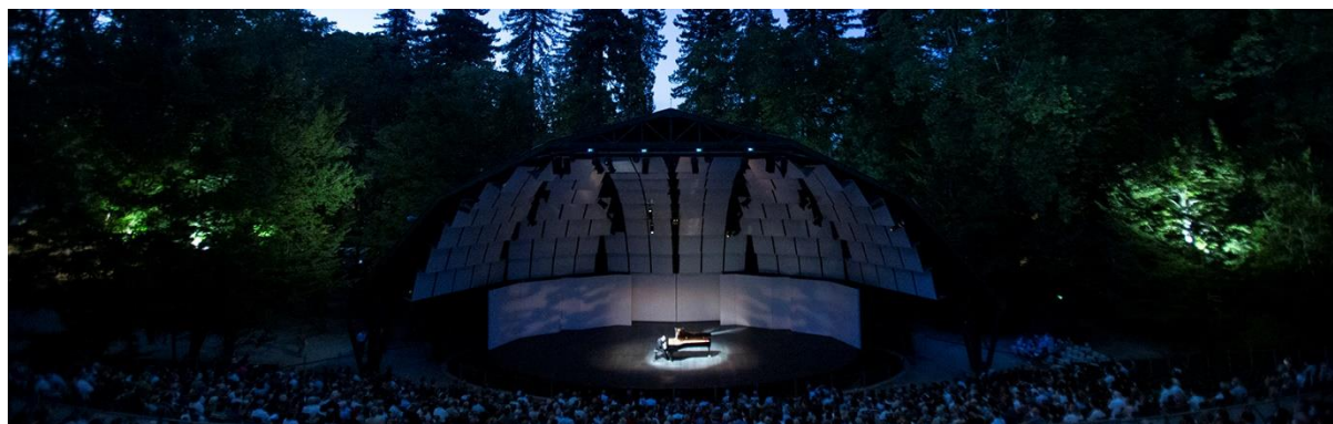
사진 14 La Roque d'Antheron 에서 열리는 피아노 페스티벌

남프랑스는 아름다운 자연, 300 일 이상의 맑은 날로 인한 축복받은 날씨로 인한 풍요로움으로 인해 철학이나 과학의 발전 보다는 음악이나 미술과 같은 예술가들이 많다는 이야기가 있습니다. 특히 7 월의 여름 밤에는 수준 높은 공연이 근처에서 많이 펼쳐집니다. 엑상프로방스의 여름 음악 페스티벌( https://festival-aix.com/en )과 더불어 특색있는 야외 음악 공연으로 La Roque d'Antheron 이라는 작은 시골마을에서 펼쳐지는 국제피아노 페스티벌( http://www.festival-piano.com/fr/accueil/bienvenue.html )과 Orange Festival ( https://www.choregies.fr/ )이 널리 알려져 있습니다. 국제 피아노 페스티벌은 엑상프로방스 근방의 La Roque d'Antheron 라는 작은 시골마을에서 펼쳐지는 피아노 페스티벌로 최근 3-4 년간 조성진, 예프게니 키신(Levgueni Kissine) 등 세계적인 피아니스트들이 참여하여 여름 밤 야외공연장에서 수준 높은 음악회를 선사하였습니다. Orange Festival 은 이탈리아 베로나 오페라 축제와 비슷하게 옛 로마시대 원형극장 내에서 여름 밤 환상적인 공연을 선사합니다. 런던, 파리나 밀라노의 오페라 하우스나 유명 극장에서 아름다운 하모니의 공연과는 달리 별이 빛나는 여름밤 자연의 소리와 더불어 연주되는 환상의 하모니는 색다른 재미와 추억을 느끼실 수 있는 기회가 되지 않을까 생각됩니다.