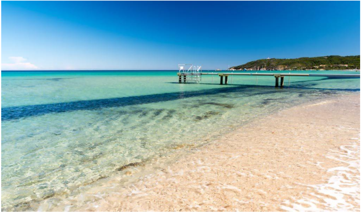
사진 11 생트로페의 근처의 해변