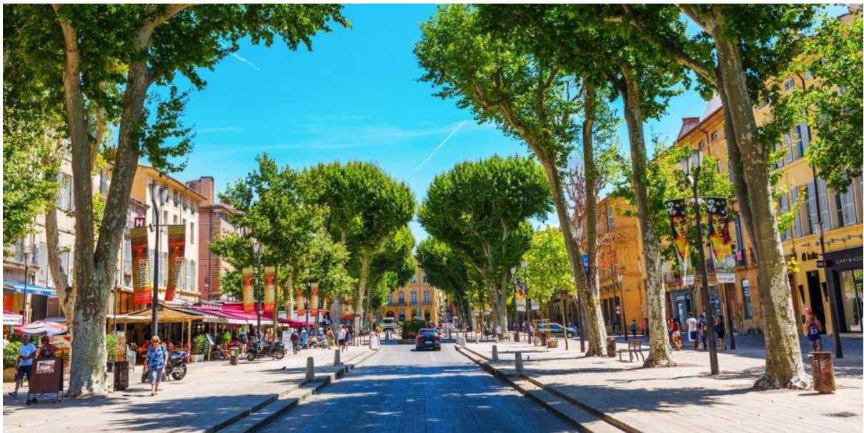
사진 6 액상 프로방스 거리 풍경