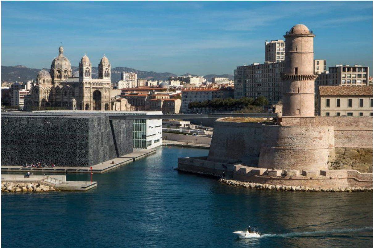
사진 2 좌측 하단에 보이는 것이 MUCEM 으로 건물 꼭대기에서 생장 요새(Fort Saint-Jean)로 넘어갈 수 있게 되어 있습니다. Fort Saint-Jean 에서 구항구를 내려 볼 수 있는 View Point 가 있으므로 함께 방문하시길 추천합니다. MUCEM 은 Rudy Ricciotti 가 설계한 건물로 서울 한강 선유교가 그의 설계 건축물 중 하나입니다.