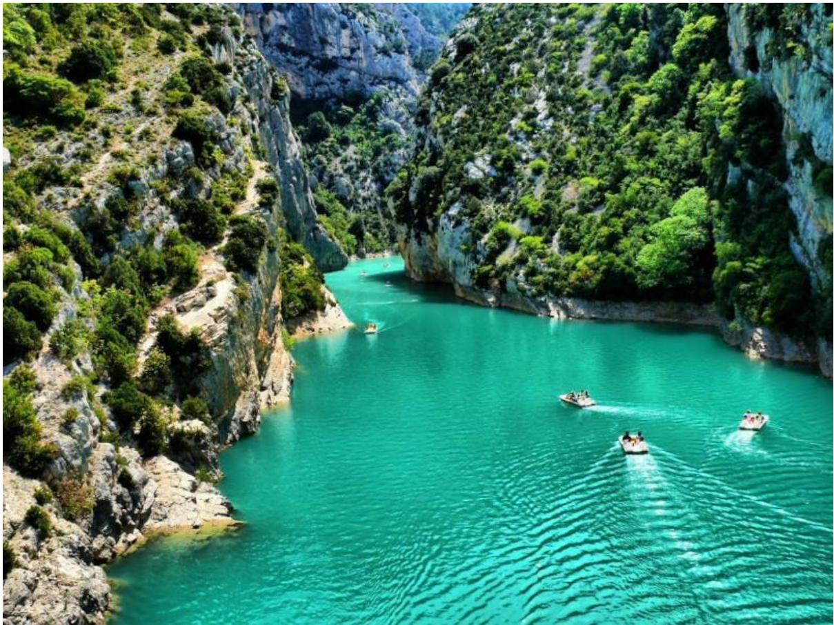
사진 7 베르동 협곡

프로방스를 소개하는 많은 방송들에 자주 소개되는 곳들로 베르동 자연 공원(Parc naturel regional du Verdon)이 있습니다. 협곡에 위치한 에머랄드 빛의 큰 호수로 유럽의 그랜드 캐년이라고도 불리웁니다. 대표적인 협곡의 호수로는 Lac de Saint-Croix, Esparron-de-Verdon 등이 있으며 여름에는 보트 투어, 수영, 호숫가 및 계곡 하이킹을 즐기는 사람들이 넘쳐 납니다. 다만 이곳은 대중 교통을 이용하기에는 불편하기 때문에 개인차량이나 렌트카를 이용해야 합니다.