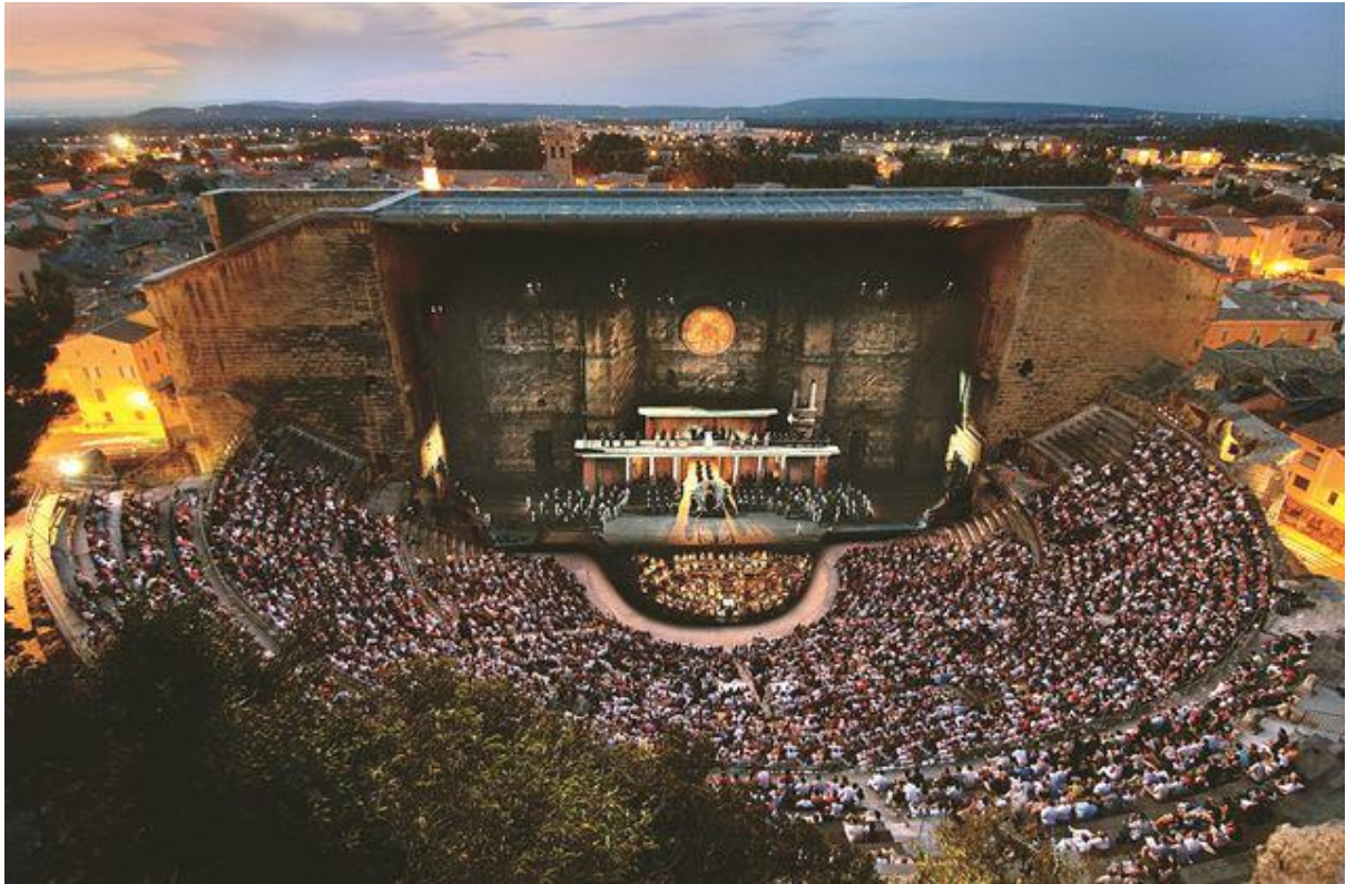
사진 15 오랑쥬 여름 페스티벌