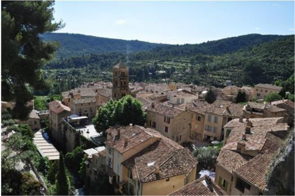
사진 8 프로방스의 예쁜 마을, 무스티에 생트마리

저기 펼쳐지므로 잠시 차를 멈추고 인생사진들을 남기실 수 있지 기회를 만들 수 있으리라 생각됩니다.